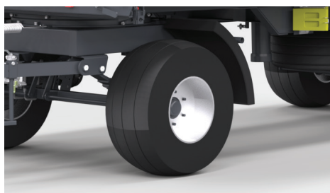
Ogumienie 400/60,15,5 - w standardzie koła nowe