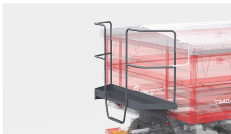
Pomost roboczy z balustradą - dopłata