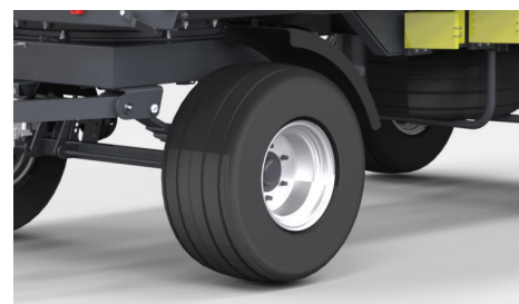
Nowe niebieżnikowane koła mają większą trwałość i odporność na uszkodzenia, co przekłada się na dłuższą żywotność i mniejszą konieczność naprawy.