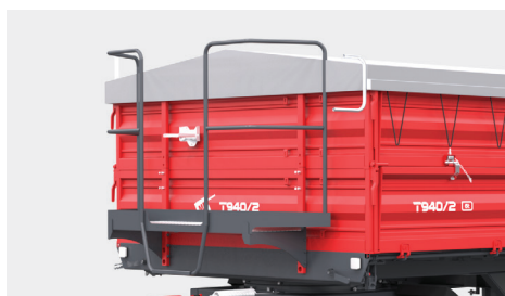
Pomost roboczy z balustradą - dopłata