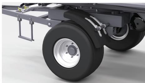
Błotniki plastikowe 4szt