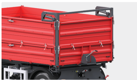
Tylna ściana zamykana hydraulicznie