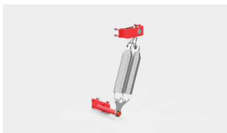
Zespół sprężyn dociskających przednią burtę