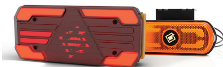
Oświetlenie LED - zapewnia niskie zużycie energii, co przekłada się na dłuższą żywotność baterii i wyższą efektywność energetyczną.