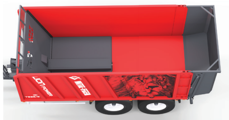
O 60 % więcej ładunku dzięki sprasowaniu materiału