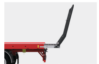
W nowej platformie do bel wysuw z 800 mm został wydłużony do 1000 mm.