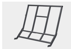
Zmieniony kształt ściany pozwala na zwiększenie ilości ładowanych bel.