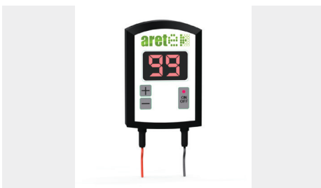
ELEKTRONICZNE STEROWANIE PODŁOGĄ (pilot przewodowy +/-))