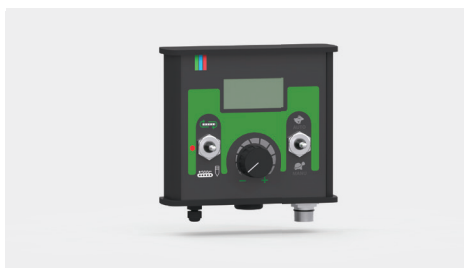
Elektronicznie precyzyjne sterowanie podłogi (pokrętko do płynnego sterowania prędkości)