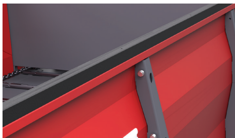
Burty osłaniane przez gumowe listwy zabezpieczające przed uszkodzeniem