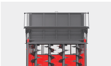
Osłona unoszona automatycznie przy podniesieniu ściany tylnej (zasuwu) (verti X4)