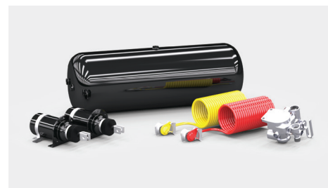
Hamulce pneumatyczne 2-przewodowe z ALB - dopłata*