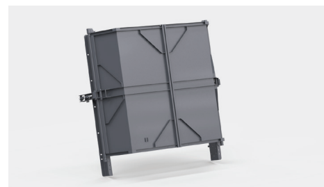
Deflektory mechaniczne (klapy, osłony) kierunku rozrzutu obornika (verti X4)