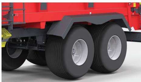
Rozrzutnik dwuosiowy typu tandem - nieresorowany (bez homologacji EU) - N267/1, N267 oraz resorowany - N267/2