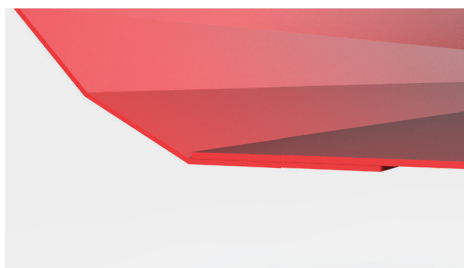
skrzynia przyczepy - podłoga wykonana z blachy grubości 5mm, ściany boczne wykonane z blacha grubości 4mm