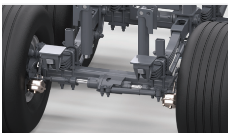
Dwie oś skątne bierne (1 i 3) z belką 120mm