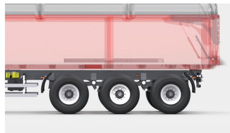
Zawieszenie 3 osiowe - TRIDEM z resorem 4 piórowym