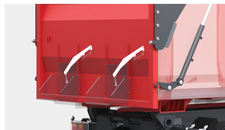
2 szyby wysypowe