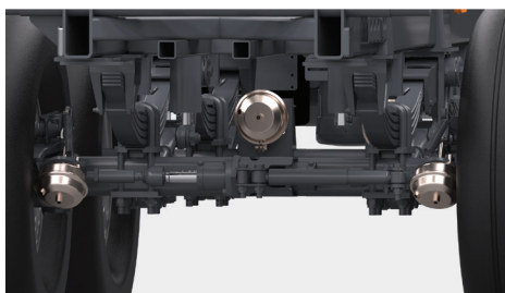
Stabilizacja hydrauliczna na 3 osi