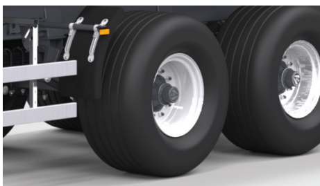
Standardowo opony 560/60-R22,5 (RADIALNE -konstrukcja opony wzmocniona)