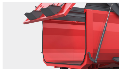
Tylna kłapa posiada uszczelkę, co gwarantuje szczelność przyczepy