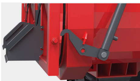
Tylna kłapa otwierana hydraulicznie - standardowo zamki hydrauliczne kłapy tylnej