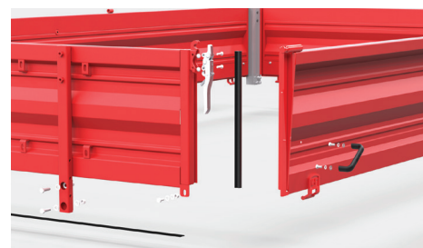
Przyczepy posiadają specjalne uszczelki które zapewniają odpowiednią szczelność