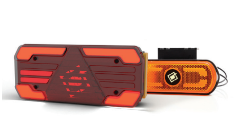
Oświetlenie LED - zapewnia niskie zużycie energii, co przekłada się na dłuższą żywotność baterii i wyższą efektywność energetyczną.