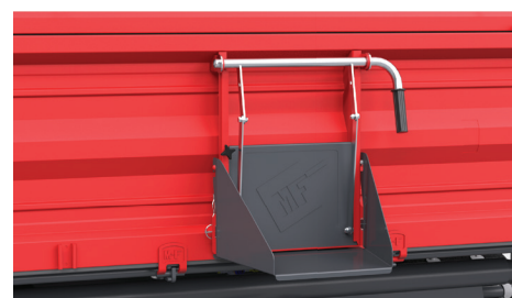
Szyber z rynną – daje możliwość precyzyjnej regulacji przepływu materiałów, co umożliwia łatwe i efektywne rozładunek zbiorów