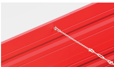
Łańcuch spinający - usztywnia ściany przestrzeni ładunkowej