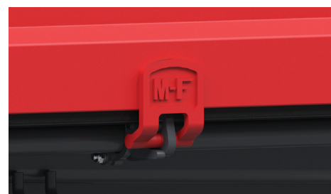
Zawiasy z logo MF – dają możliwość łatwego otwierania i zamykania burty, co ułatwia załadunek i rozładunek materiałów.