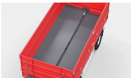
Podłoga wykonana z dwóch kawałków materiału pozwala na uzyskanie większej sztywności maszyny