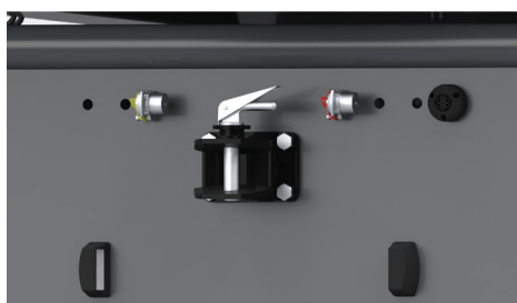
Media – hydraulika i elektryka do drugiej przyczepy