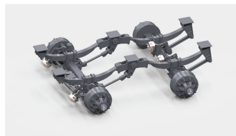
Oś 150x150, zawieszenie hydrauliczne - dopłata