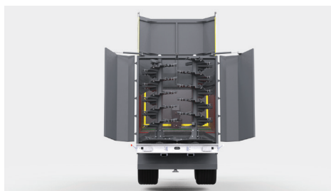
Tylna kłapa unoszona hydraulicznie