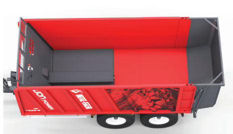
O 60 % więcej ładunku dzięki sprasowaniu materiału