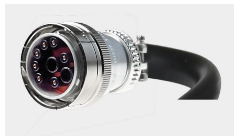
System wagowy, isobus