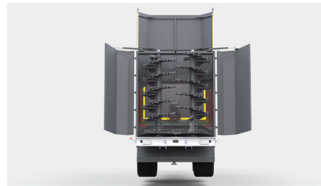
Możliwość zmiany przyczepy w rozrzutnik po zamontowaniu adaptera pionowego