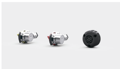
Media – hydraulika i elektryka do drugiej przyczepy