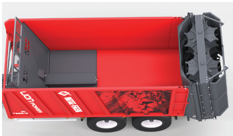
Możliwość zmiany przyczepy w rozrzutnik po zamontowaniu adaptera poziomego