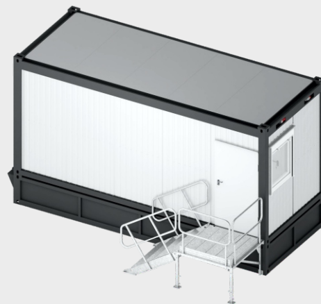
Przykładowy kontener sanitarny. Widok zewnętrzny

Specjalizujemy się w tworzeniu mobilnych systemów pomieszczeń dostosowanych do unikalnych wymagań każdego projektu. W ścisłej współpracy z klientami projektujemy i realizujemy rozwiązania idealne dla ich specyficznych potrzeb. Zachęcamy do kontaktu i przedstawienia zapytania, byśmy mogli opracować dedykowane rozwiązanie, które w pełni zaspokoi wymagania Państwa projektu. Oferujemy elastyczne podejście i indywidualną obsługę, gwarantującą najwyższą jakość i pełną satysfakcję z końcowego rezultatu.