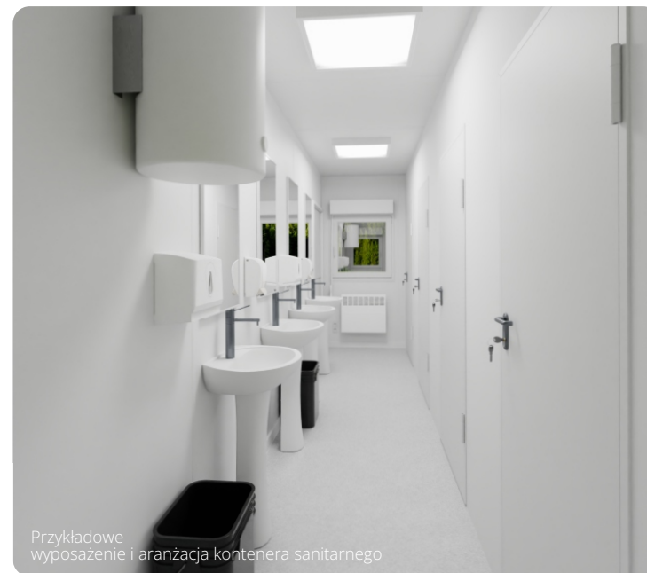
Przykładowe wyposażenie i aranżacja kontenera sanitarnego